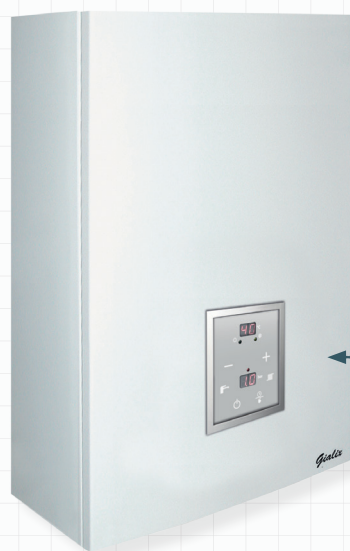
Tableau de bord à commandes digitales en façade et simple d'utilisation